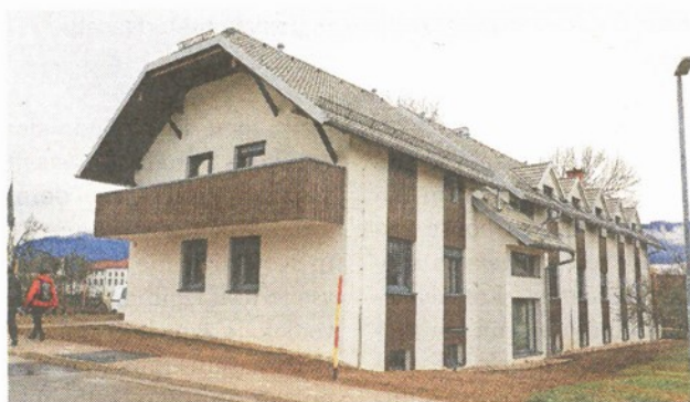
Stanovanja, ki jih gradi Pokojninski sklad, bodo namenjena starejšim od 65 let in bodo najemniška.

V preteklosti je bila lastnica tretjinskega deleža stavbe tudi Občina Radovljica, ki pa je svoj delež pred nekaj leti prodala Nepremičninskemu skladu.