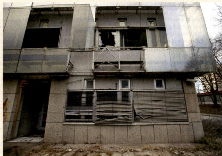
Bi tudi vi kupili stanovanje tako, da bi njegovo velikost ocenili iz letala? Na fotografiji fantomska stavba na Litijski v Ljubljani.