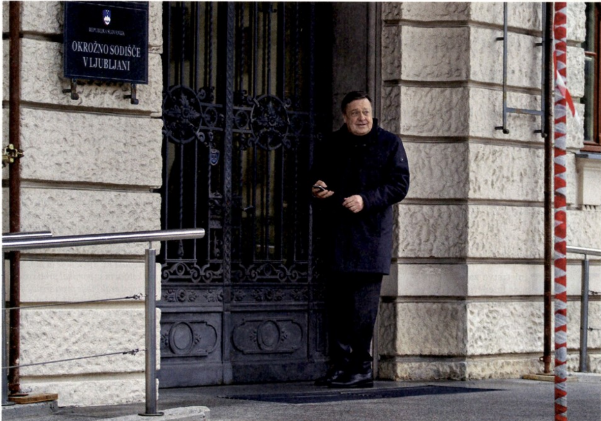
Ljubljanski župan Zoran Janković med prihodom na eno izmed brezštevilnih sodnih obravnav na ljubljanskem okrožnem sodišču.

zlorabe uradnega položaja ali uradnih pravic. Kazenski zakonik nič ne govori o namelih ali celo o dobrih namelih.