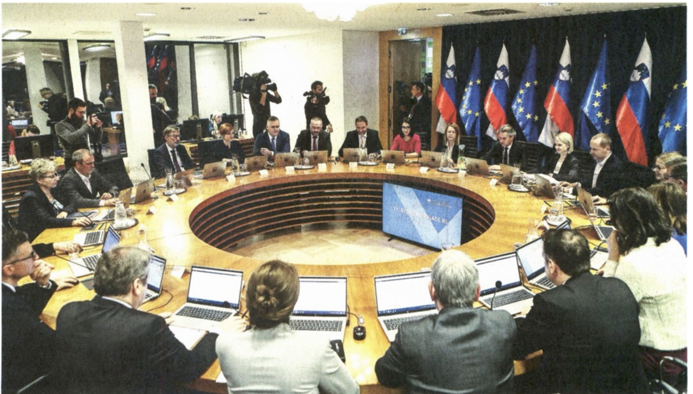
Pred dobrim letom dni je vlada Roberta Goloba začela delovati v popolni sestavi po prenovljenem zakonu. V njej je 20 ministrov. © Luka Cjuha DOCUMENTACIJA DNEVNIKA