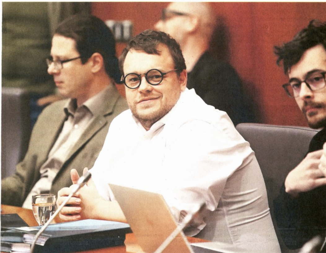
stanovanja za mnoge postala nedostopna dobrina.