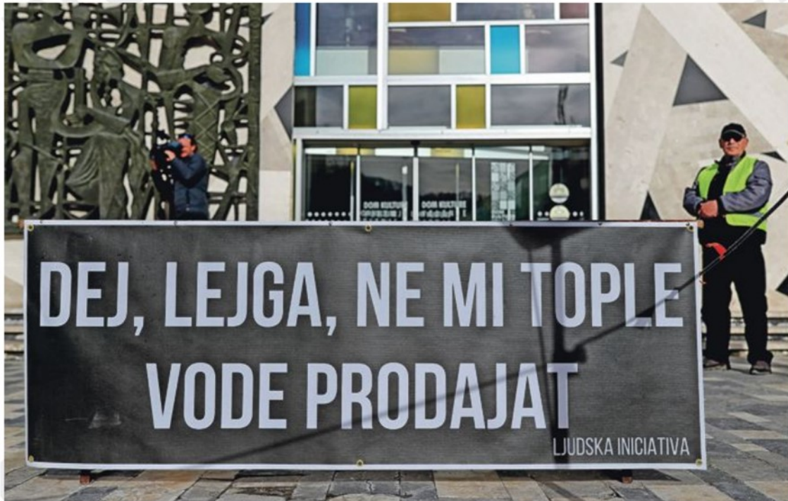
V Šaleški dolini imajo dovolj visokih cen ogrevanja.