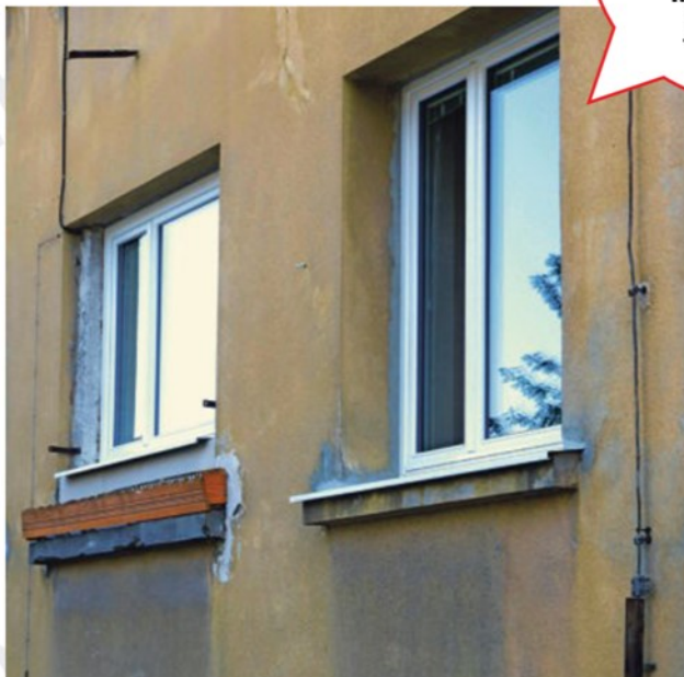
Subvencionirana je tudi zamenjava oken.

LJUBLJANA ◉ Potem ko je vlada konec novembra sprejela akcijski načrt za zmanjšanje energetske revščine, katere cilj je prepoloviti delež energetske revnih gospodinjstev, je zdaj ponovno zvišala sredstva, ki so na voljo za subvencije investicij v ukrepe večje energetske učinkovitosti stavb in rabe obnovljivih virov energije. Poziv je bil objavljen 1. decembra lani; sprva je bilo zanj predvidenih pet milijonov evrov, nato je Eko sklad 29. decembra lani sredstva povečal na 10 milijonov, zdaj znesek znaša 20 milijonov evrov.