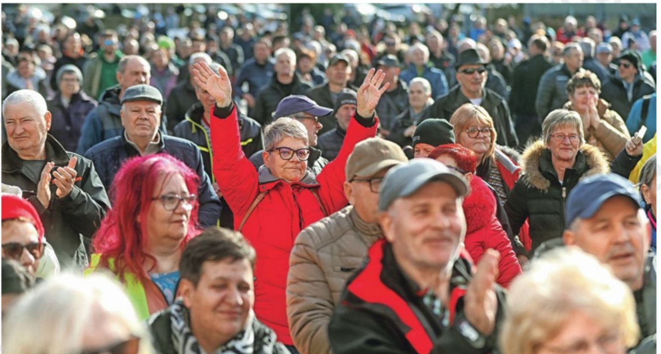
Titov trg se je na sobotno dopoldne hitro napolnil.