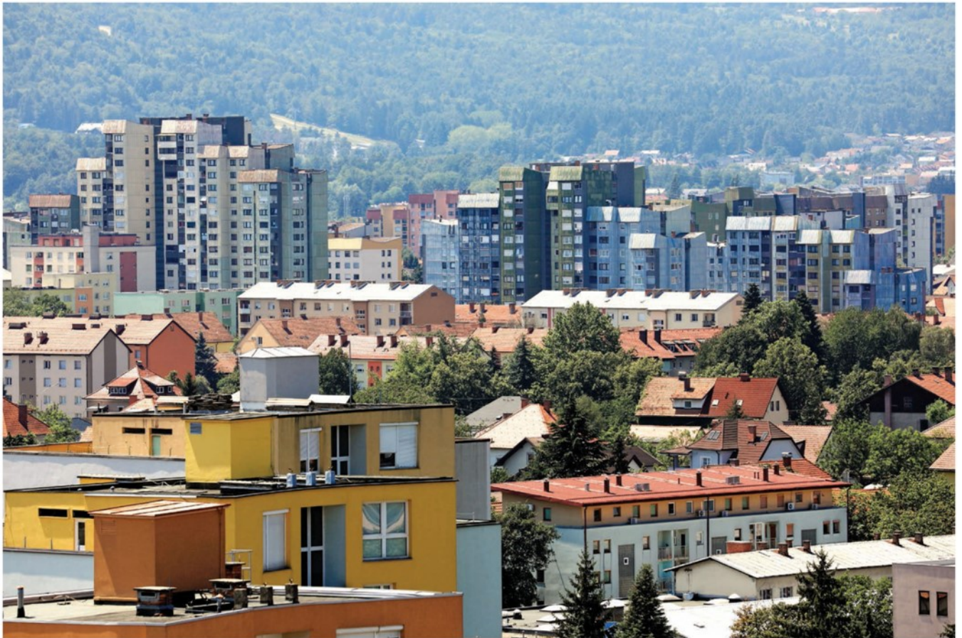
So bloki v naselju S-23, ki so ostali v sedemdesetih letih prejšnjega stoletja.