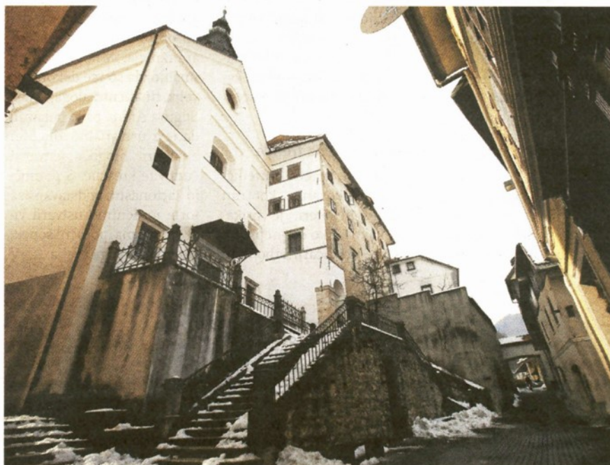
Lastnica Nunskega samostana bo postala Občina Škofja Loka.

ških razmerij, je pojasnila vodja oddelka za pravne zadeve in nepremično premoženje na Občini Škofja Loka Polona Gortnar. Kot solastniki stavb so trenutno poleg