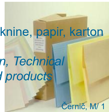
Černič, M/ 1