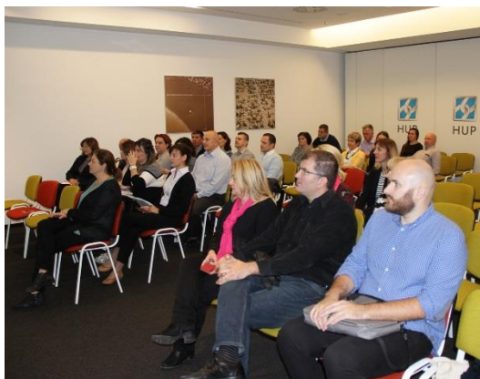
Nacionalna skillME konferencija u Hrvatskoj 29. rujna 2017. – Zagreb, Hrvatska

Konferencija su polučile velik interes i bile su dobro posjećene od strane tvrtki koje bi željele dodatno osposobiti svoje radnike te od pružatelja usluga strukovnog obrazovanja.