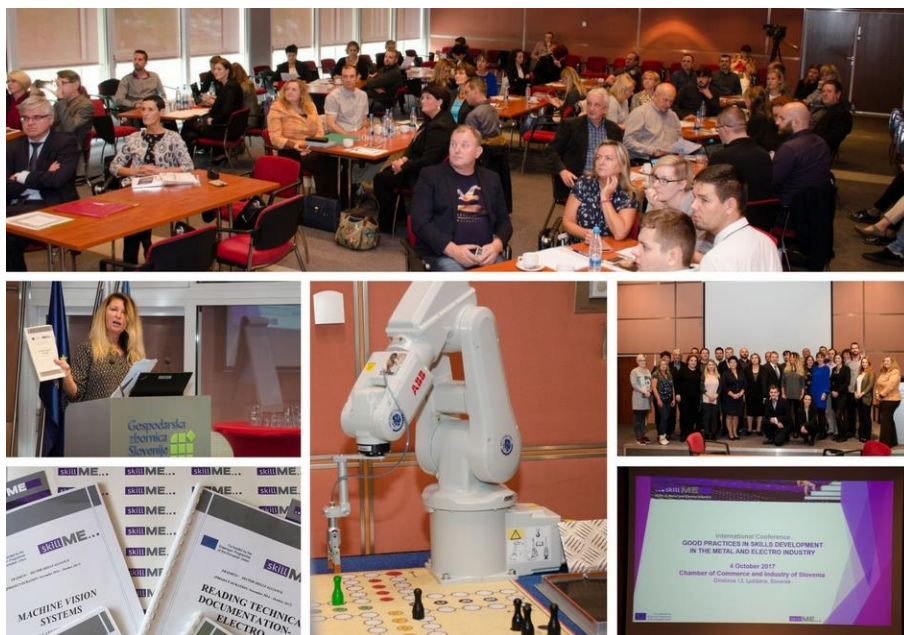
Međunarodna skillME konferencija u Ljubljani, Sloveniji

Učitelji i student su također predstavili svoja konkretna iskustva s pilot treninzima i njihovom implementacijom te su prezentirali iskoristivost treninga na temelju Strojnog vida – korištenja kamere za kontrolu robota.