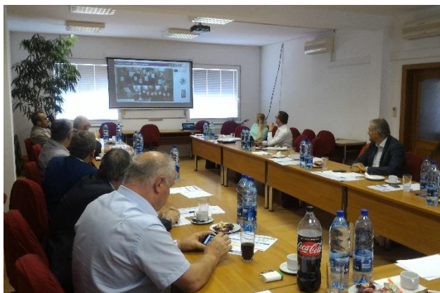
Nacionalna skillME konferencija u Slovačkoj 6. listopada 2017., Pezinok, Slovačka