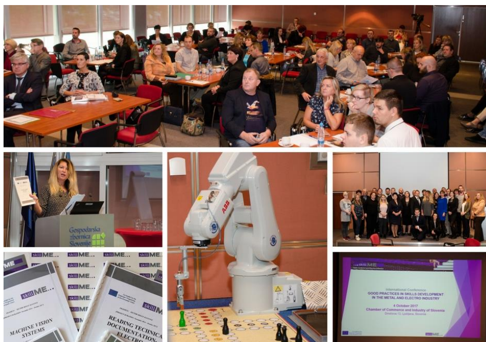
Međunarodna skillME konferencija u Ljubljani, Sloveniji

Učitelji i student su također predstavili svoja konkretna iskustva s pilot treninzima i njihovom implementacijom te su prezentirali iskoristivost treninga na temelju Strojnog vida – korištenja kamere za kontrolu robota.