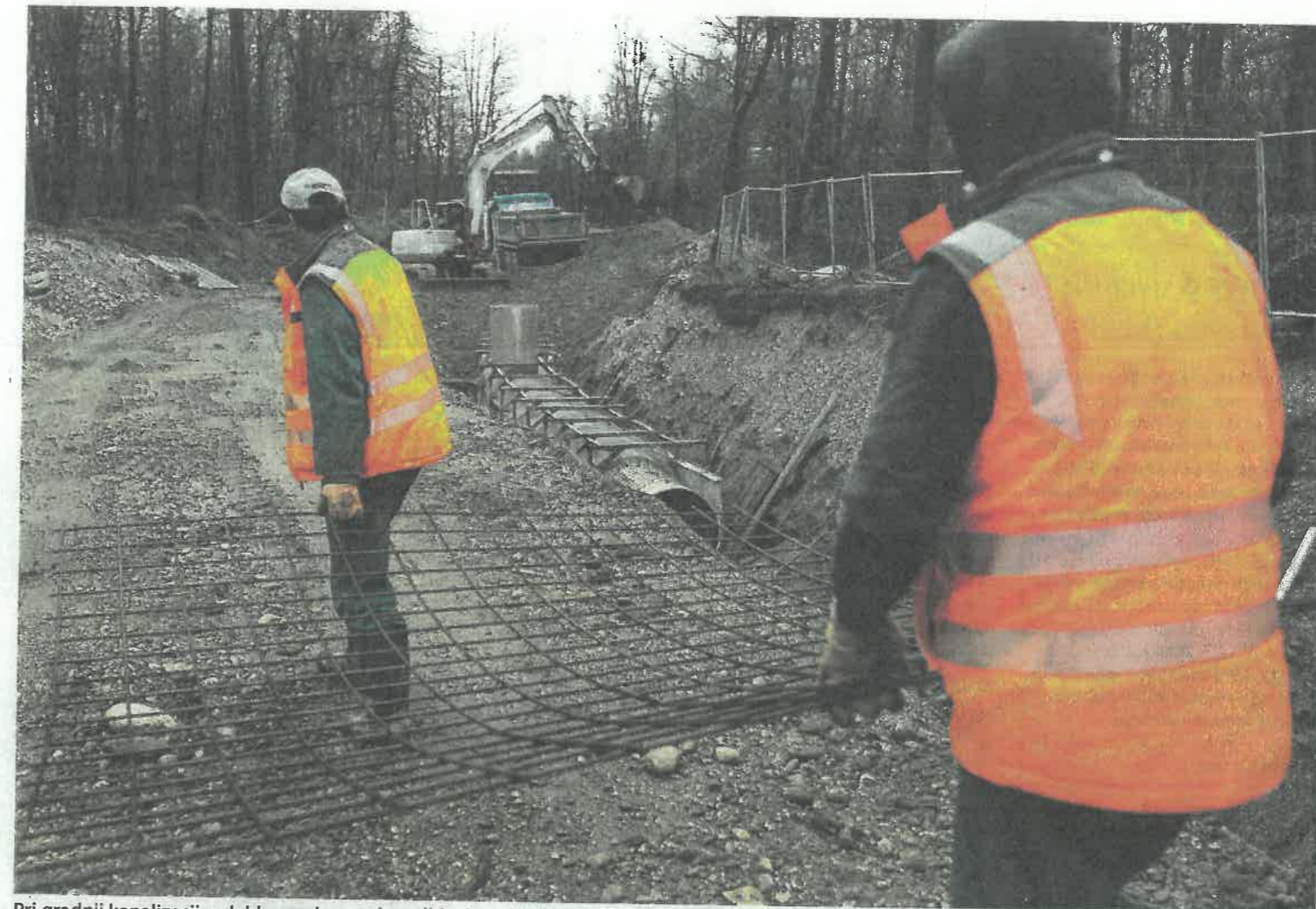
Pri gradnji kanalizacij se lahko zaplete, saj gradbinci ne dobijo cevi in jaškov, ti pa so tako kot železo tudi dražji.

Plastični izdelki pa so se podražili zaradi višjih cen polimerov, torej materiala za plastiko. »Rast cen polimerov je posledica manjše dejavnosti rafinerij; povpraševanje po gorivih za osebno mobilnost je zaradi zaježitvenih ukrepov v Evropi še vedno precej manjše od običajnega, kar pomeni tudi manjšo proizvodnjo stranskih proizvo-