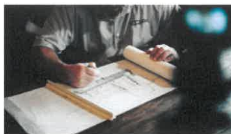
📷 Predlog zakona po mnenju Zbornice za arhitekturo in prostor celo dopušča, da se celotna projektna dokumentacija za stavbo izdela povsem brez sodelovanja arhitektov.

Dodajajo, da bo vodja projekta lahko arhitekta k načrtovanju povabil šele v fazi projekta za izvedbo in da bo takrat arhitektura podrejena rešitvam, ki jih je že določil geodet ali strojni inženir kot vodja projekta. "Takrat lahko arhitekt doprinese zgolj še dekoracijo," pravijo. Predlog po njihovem mnenju celo dopušča, da se celotna projektna dokumentacija za stavbo izdela povsem brez sodelovanja arhitektov. "Ministrstvo za okolje in prostor s tem dolgoročno ukinja potrebo po arhitekturni stroki sploh," poudarjajo.