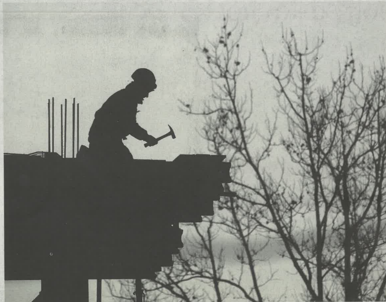
Na višje stroške so močno vplivali višji stroški dela, ki so bili v prvem četrtletju 11,6 odstotka višji kot v zadnjem lanskem, ko so bili devet odstotkov nižji kot v predhodnem četrtletju.

»Že nabavna cena armature presega našo prodajno ceno, v katero so vključeni tudi krivljenje, transport in vgraditev,« opozarja član uprave novomeškega gradbinca CGP Edo Škufca. Gradbinci v nove ponudbe že vračunavajo višje cene materialov in dela, hkrati pa se z naročniki pogovarjajo o upoštevanju podražitev materialov pri projektih, za kateré so pogodbe že podpisane.