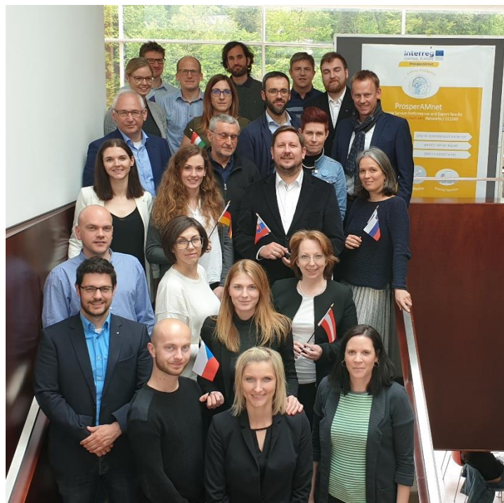
Skupinska fotografija projektnih partnerjev ProsperAMnet z uvodnega srečanja 6. In 7. maja 2019