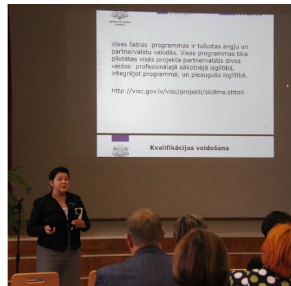
Levo: hrvaška nacionalna konferenca, 29. septembra 2017, Zagreb; sredina: slovaška nacionalna konferenca, 6. oktobra 2017, Penzios; desno: latvijska nacionalna konferenca, 12. oktobra 2017, Riga.