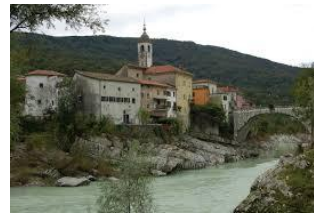
KANAL OB SOČI