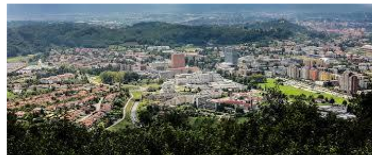
MESTNA OBČINA NOVA GORICA