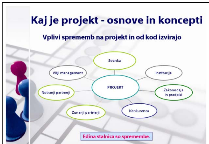
Slika: Primera elektronskih prosojnic