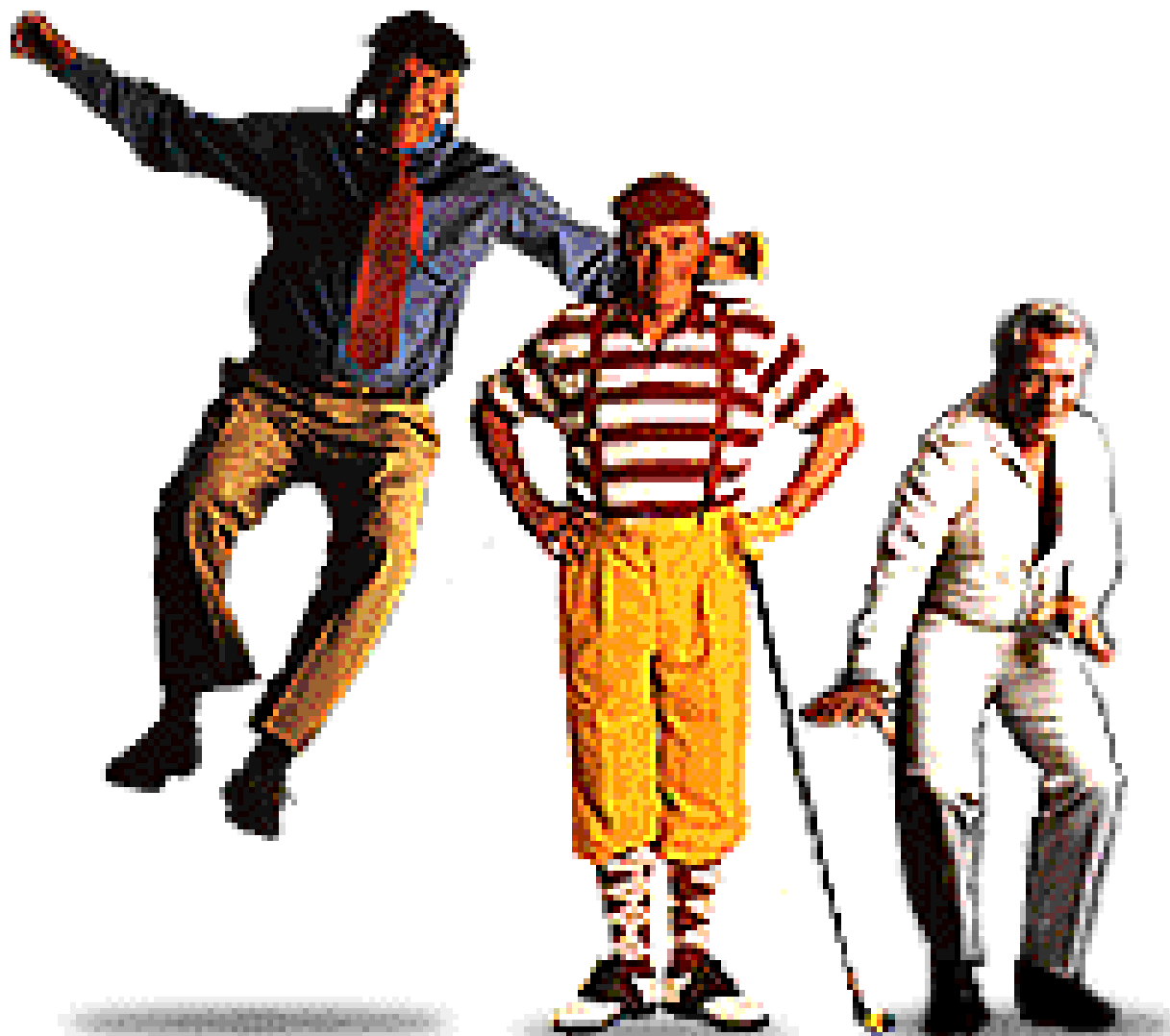
Chairman, President & CEO Herb Kelleher Southwest Airlines