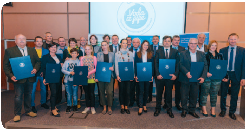
Prejemniki certifikata Voda iz pipe na podelitvi dne 5. 11. 2019, GZS